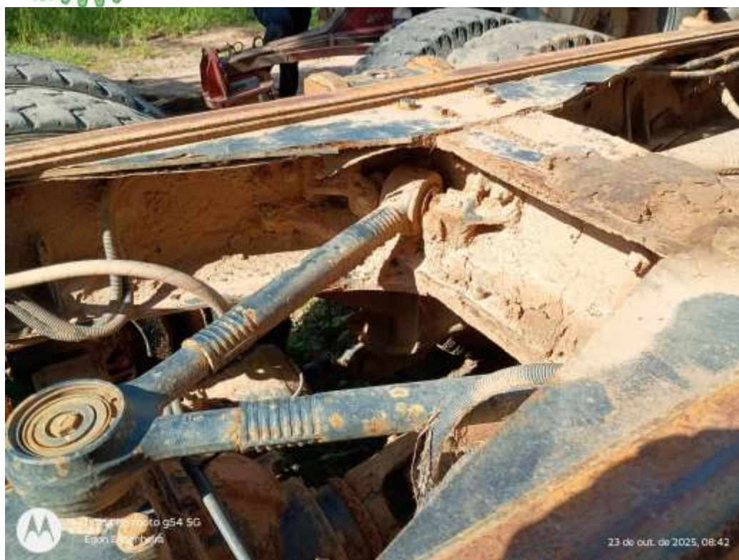
Instalação de porcas rodas