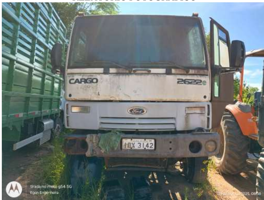
Conjunto bloco óptico e para-choque