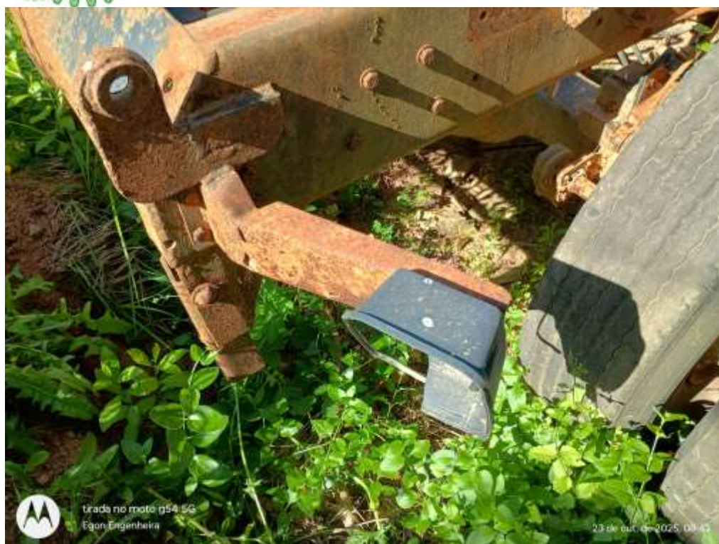
Instalação tampa filtro de ar

Instalações Industriais - Construções civis, elétricas e mecânicas