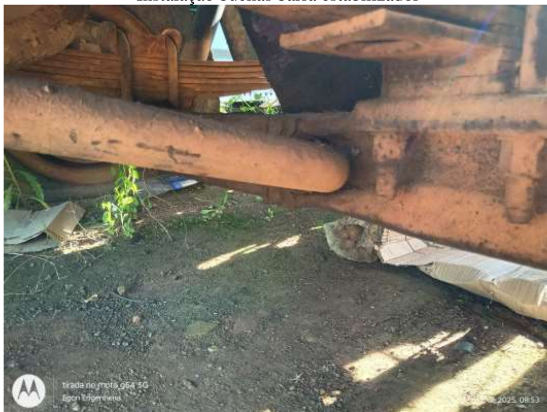
Instalação motor de partida